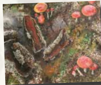
2 o Premio - Bigarren Saria "MUSCARIA" AGUSTIN PONTESTA